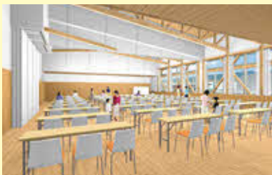
多目的スペース(イメージ)

熊本県では、「命を大切にし、やさしさあふれる人と動物が共生するくまもと」の実現を目指し、来年3月にその中核拠点となる新しい動物愛護センターがオープンします。県産木材の温もりを感じる新センターは、保護された犬猫と新しい飼い主の“出会いの場”であるとともに、しつけ方教室や子どもへの命の教育などを通して、広く動物愛護の啓発を進めていきます。やさしさにあふれ、みなさまに親しんでいただける「愛称」を募集します。